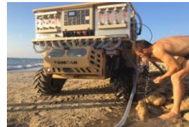
רכב התפלה = "מוביל פרואקטיבי"