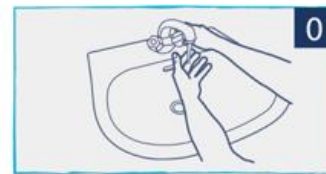
הרטיבו ידיים במים