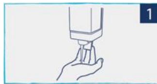
השתמשו בכמות נדיבה של סבון