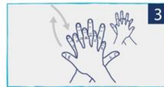
כף יד אל גב כף יד בשילוב אצבעות