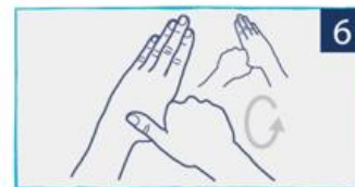
לשפשף את האגודלים בתנועה סיבובית