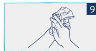
ייבשו במגבת נקיה או בנייר ניגוב