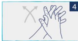
כף אל כף בשילוב אצבעות