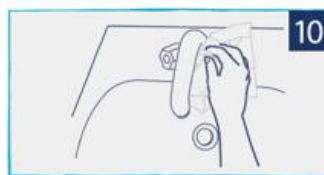
השתמשו במגבת לסגירת הברז