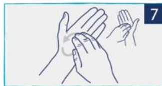
לשפשף את הציפורניים בתנועה סיבובית אל תוך כף היד