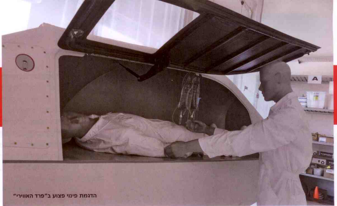
הדגמת פינוי פצוע ב"פרד האוויר"