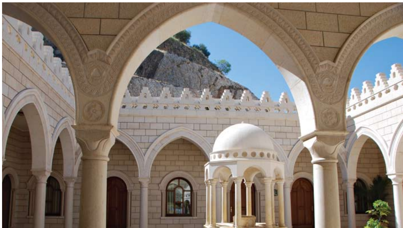
קבר נבי שועיב למרגלות קרני חיטין, האתר השני בקדושתו לדרוזים בכל העולם והקדוש מכול בארץ

יום ואילך אי אפשר עוד להצטרף לדת הדרוזית. כאמור, על פי האמונה הדרוזית, מספרם של בני הדת קבוע מאז נעילת שעריה. עובדת היותם של הדרוזים מיעוט משפיעה כמובן רבות על ההיסטוריה שלהם. במהלך ההיסטוריה היו שני מקרים בלבד שבהם צורפו משפחות לדת מעט לאחר נעילת השערים - ג'ונבלט וארסלאן, שתיהן משפחות אצולה מבוססות. הראשונה צורפה באופן מלא לעדה בעוד על בניה של השנייה נאסרו נישואים עם בנות העדה. שתי המשפחות האלה שלטו בעדה במהלך מסעות הצלב ונלחמו, לצד המוסלמים, נגד הצלבנים. נעילת השערים קיבעה את בני העדה הדרוזית כמיעוט בתוך רוב שאינו דרוזי. כבני מיעוט שידע פעמים רבות רדיפות וגזרות, נאלצו הדרוזים להצטיין