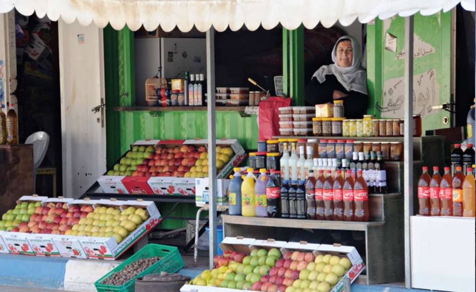
תוצרת חקלאית של הדרוזים בצפון רמת הגולן

מכיוון שהנשמה נתפסת על ידם כנצחית וככזו שמיד עם המוות ממשיכה את מסעה הלאה, אל הגוף הבא, אין הדרוזים מקדשים קברים. הקבורה הדרוזית נעשית לרוב באופן משפחתי, מעל האדמה - בכוכים או במבנים מיוחדים, ללא ציון שמותיהם של הנפטרים או כל פרט מזהה אחר