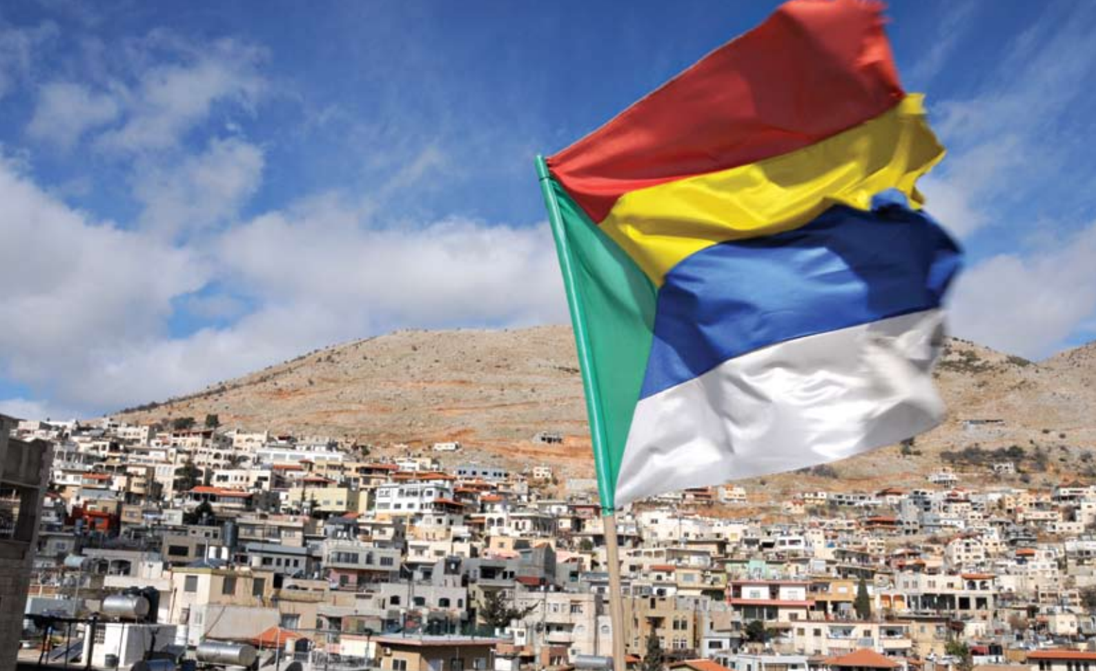
הדגל הדרוזי בן חמשת הצבעים, מג'דל שמש

מופשטת לחלוטין "היה עליה" לייצג את עצמה באופן כלשהו כדי לבוא לידי ביטוי בעולם החומרי. לשם כך היא יצרה את התבונה האוניברסלית ואת האמת האוניברסלית. אבן-עלי הסביר כי אל-חאכם, האלוהים, אפשר להם לראות את "הצעף" שממסך אותו, את "מקור החסד". האלוהות גם אפשרה בחירה חופשית - לדבוק בה או להתכחש לה, וכך נוצר הרע בעולם. הדת הדרוזית מכירה בחמישה מתווכחים עיקריים בין האלוהות לעולם. הראשון שבהם, תבונת העולם, מגולם באבן-עלי. חמשת המתווכחים מסומלים גם בחמשת צבעי הדגל הדרוזי - ירוק, כחול, אדום, צהוב ולבן. הדרוזים מאמינים בשבעה נביאים שקמו מאז בריאת העולם: האדם הראשון, נח, אברהם, משה, ישוע , מוחמד ו איסמעיל - האימאם השיעי השביעי. על פי אמונתם לכל אחד מהנביאים היו יועצי סתרים