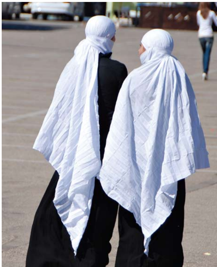
נשים דרוזיות בלבוש מסורתי

בשנת 1840, עם נפילתם של פאשה ועלי וכיבוש עות'מאני מחדש באזור, פרצה בלבנון מלחמת אזרחים עקובה מדם בין הדרוזים למארוניים. במהלך 20 שנה נהרגו כמאה אלף בני אדם. הדרוזים אמנם ניצחו במרבית הקרבות, אבל בסופו של דבר הפסידו במערכה. בשנת 1860 נחתו הצרפתים בחופי לבנון והעניקו תמיכה צבאית רבה למארוניים. כך הושגה הפסקת אש, אבל רבים מהדרוזים ברחו לג'בל דרוז בחורן. את ההנהגה בג'בל דרוז תפסה משפחת אל-אטרש, שממנה בא הזמר המפורסם פאריד אל-אטרש . בזכות הסולטן הדרוזי סלים אל-אטרש , זכו הדרוזים בחורן לקבל מהצרפתים אוטונומיה בשנת 1921. קודם לכן, בשלהי המאה ה-19, הם מרדו בשלטון התורכי. למרידה זו יש השלכות על גבולה הצפוני של ישראל. למשל, מכירת אדמות לפקידי ה ברון רוטשילד כדי להשתחרר מעול הכפרים הדרוזיים "המטרידים". לאחר מות אל-אטרש מונה מושל צרפתי זמני - קפטן קרבייה , שפעל להקמת בתי ספר ובתי משפט, פרץ דרכים ועוד. מעשיו היו שנויים במחלוקת. דרוזים רבים חשו שהם מאבדים את שלטונם העצמי ואת זהותם. הם מחו ונדחו. כמה שנים אחר כך, בשנת 1927, פרץ מרד דרוזי נגד הצרפתים. המרד אמנם נכשל, אבל הצרפתים הבינו שכדאי להם להגיע להידברות עם המורדים. כך קיבלו הדרוזים את חלקם באמנת לבנון שחוברה ב-1943.