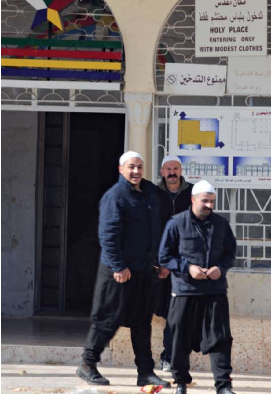
הכניסה לקברו של נבי יעפורי בצפון רמת הגולן